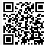
คู่มือการใช้งาน e-Voting

*หมายเหตุ การทำงานของระบบประชุมผ่านสื่ออิเล็กทรอนิกส์ และระบบ Inventech Connect ขึ้นอยู่กับระบบอินเทอร์เน็ตที่รองรับของผู้ถือหุ้นหรือผู้รับมอบฉันทะ รวมถึงอุปกรณ์ และ/หรือ โปรแกรมของอุปกรณ์ กรุณาใช้อุปกรณ์ และ/หรือโปรแกรมดังต่อไปนี้ในการใช้งานระบบ