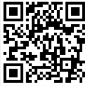
คู่มือการใช้งาน e-Request